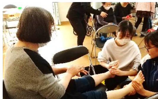
フットトリートメントを 体験してみましょう