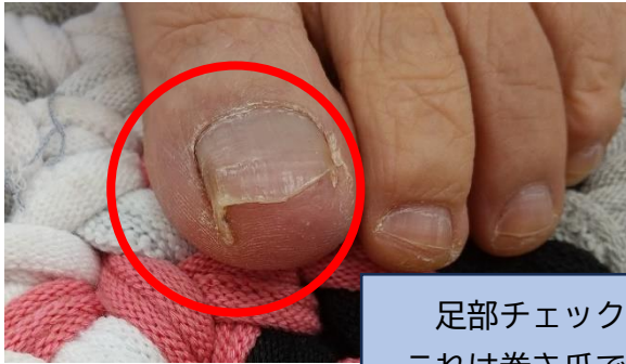
足部チェック これは巻き爪です