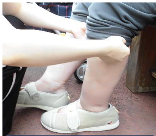
靴のサイズは大丈夫？

提供された個人情報は、プログラムの連絡・開催案内・保険加入等に使用します。また、個人情報の漏洩には十分注意し、プログラムの終了後には適切に消去します。